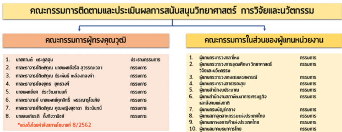
รูปที่ 1 โครงสร้างคณะกรรมการติดตามและประเมินผลการสนับสนุนวิทยาศาสตร์ วิจัย และนวัตกรรม